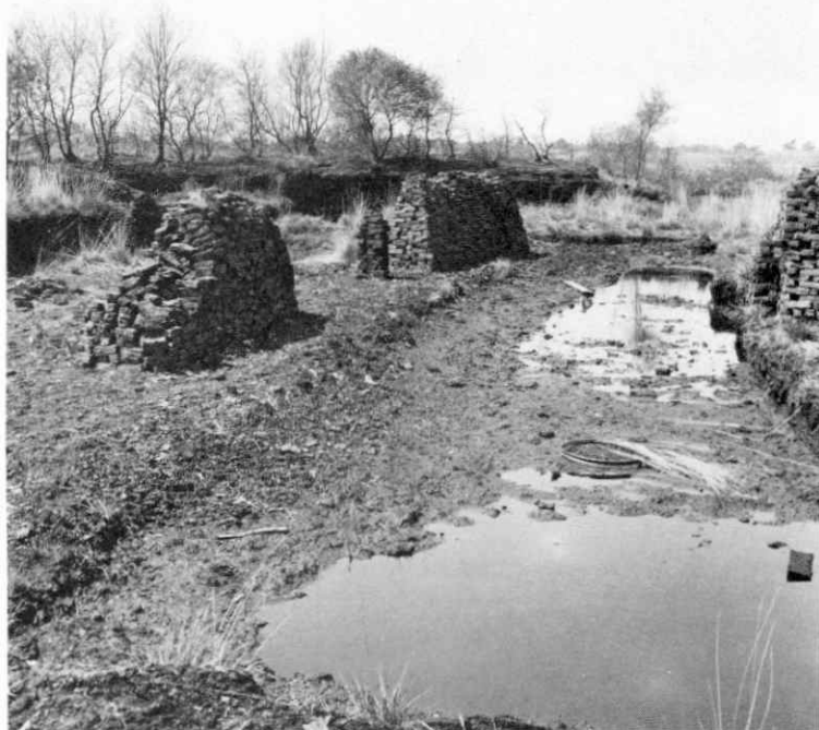
...turfveld in de Peel...

In dit negental dorpen vormen buurtschappen als Hoogdonk, Vreekwijk, Heittrak, Panoven, Moosdijk, Schans, Goor, Voorpeel, Hanenberg, Snoerts en Riet vrij afgeronde groeperingen.