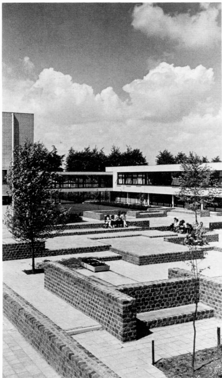
...een streekfunctie op onderwijsgebied vervult het Peelland-college met ondermeer richtingen voor h.a.v.o., atheneum en een handelsavondschoonl...