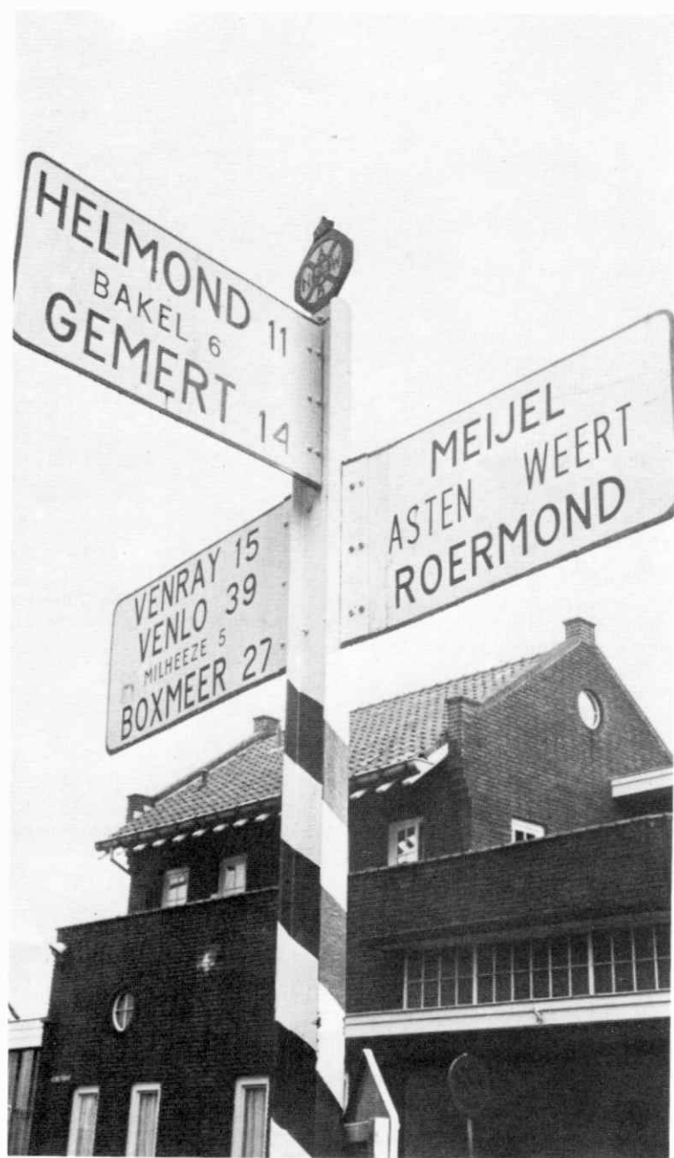
...door de aanleg van wegen werd Deurne vanuit alle richtingen gemakkelijk bereikbaar....