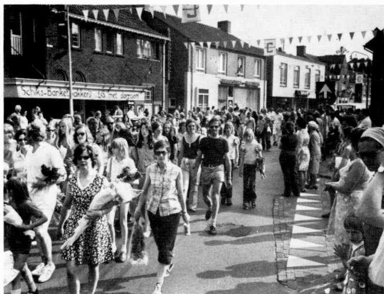
....met forse stappen voorwaarts wordt de wandelsport beoefend. Hoogtepunt in dit onderdeel van het plaatselijk sportgebeuren is de traditionele avondvierdaagse....