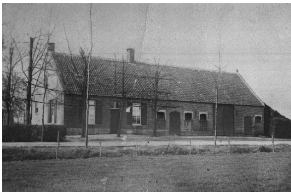
De nieuwe boerderij die in 1905 na de brand verrees.