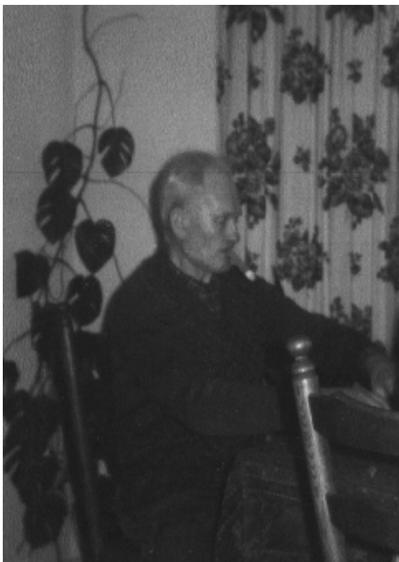
Dorus rikt onder het genot van een sigaar

Een andere wekelijkse bezigheid was het rikken met buurman en buurvrouw Winkelmolen die inmiddels vanuit de boerderij in een bungalow naast hun waren komen te wonen.