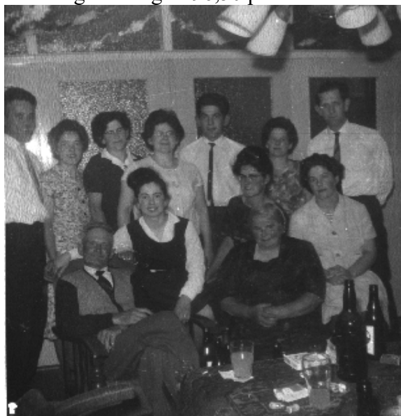
Feest met de eigen kinderen .....