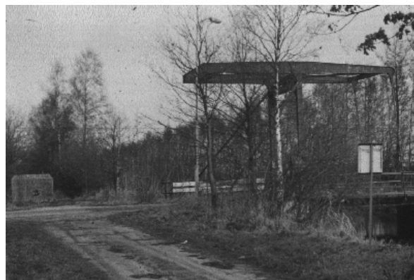
Daar bij die Lage Brug !

Deurne'. Het was ook in dit kanaal dat enkele bruggen kwamen te liggen, met name de 'Hoge Brug' aan de weg van Helenaveen naar Liessel en de 'Lage Brug' aan de weg van Helenaveen naar Neerkant.