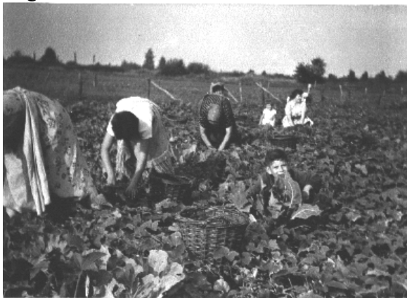
Volop aan het werk op d'n augurkenplak

Het bedrijf begon zich tot een gemengd bedrijf te ontwikkelen, van alles wat, koeien, varkens, kippen, tuinbouw in de vorm van bonen, erwten, augurken, peulen en tuinbonen (eerst onder platglas voorgekiemd) maar ook bieten en wat graan. Tussen de tuinbonen werden de augurken gepoot, die uitgroeiden als de tuinbonen af waren.