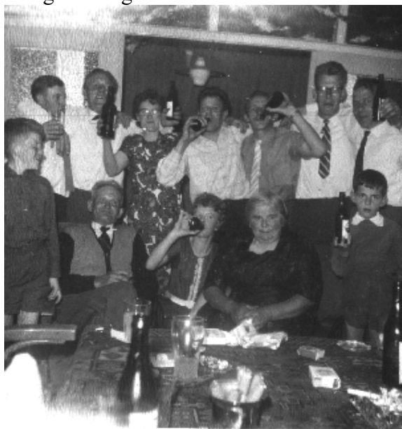
En ook met de aanhang. Proost !!

Op deze verjaardag werden, net zoals ook op alle andere verjaardagen, de bloemetjes weer danig buiten gezet.