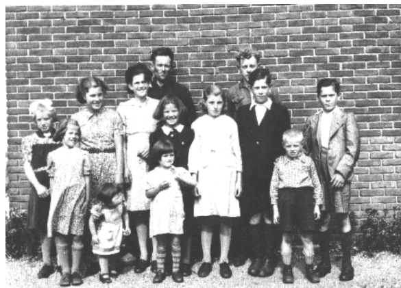
Het (bijna) voltallige gezin, samen met neven en nichten in juni 1944